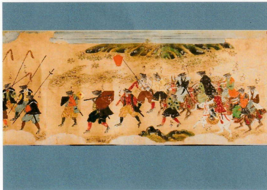
奈良絵巻 鼠草紙残巻