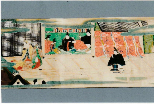
奈良絵巻 伊勢物語